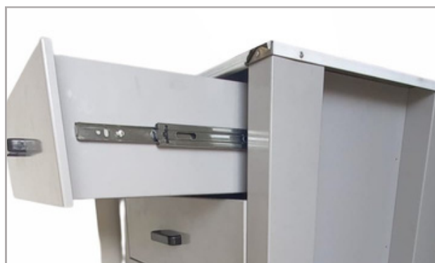
Diversos itens opcionais