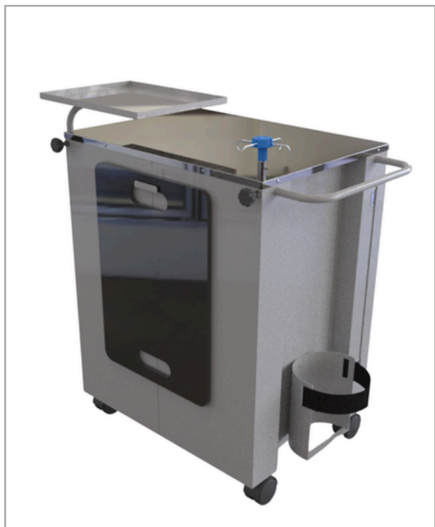
Completo, leve e compacto